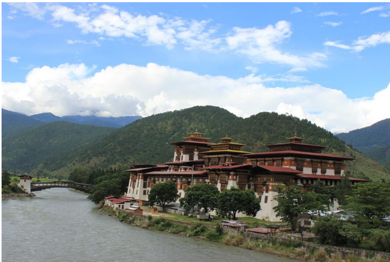
Пунакха-дзонг, или Дворец Великого Счастья

Посещение Пунакха-дзонга (Дворца Великого Счастья). Во дворце находится мавзолей Шабдรุงга (основателя Бутана, жившего в XVII в.) и королевская сокровищница. Дворец находится в живописном месте и отличается архитектурным изяществом.