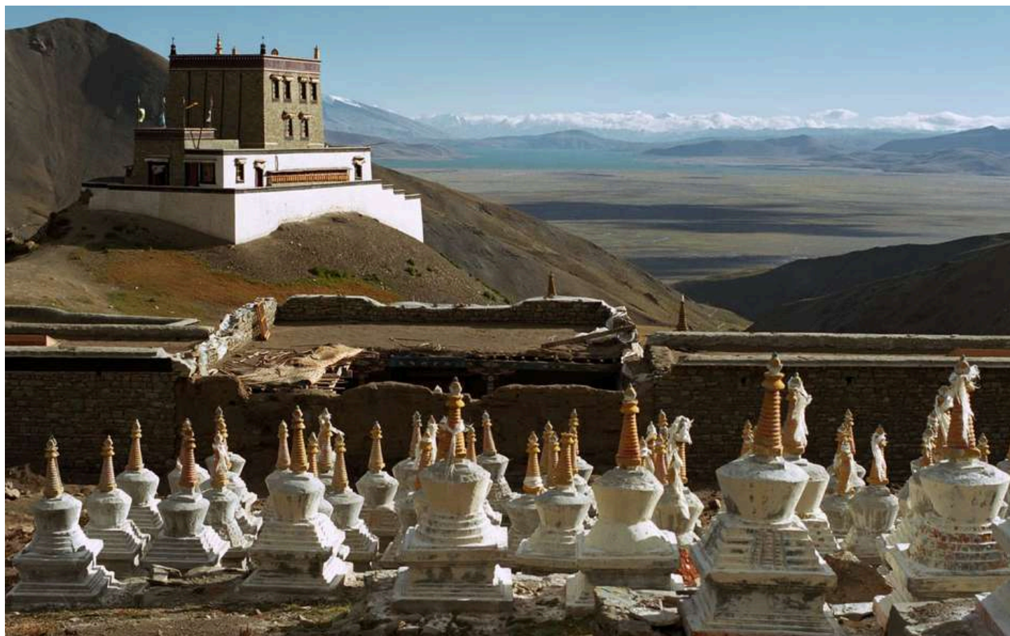
Монастырь Гьянгдрак на маршруте внутренней коры и озеро Ракшас Тал

Прохождение внутренней коры не гарантируется, так как официально этот маршрут закрыт. Кроме того, внутреннюю кору нельзя проходить в плохую погоду, при сильном снегопаде, дожде или тумане. Маршрут внутренней коры считается опасным из-за вероятности камнепадов. Пройти этот маршрут могут только опытные и хорошо подготовленные трекеры. Если вы не хотите пройти маршрут полностью, вы можете дойти только до монастыря Гьянгдрак (5060 м.) Ночевка в Дарчене.