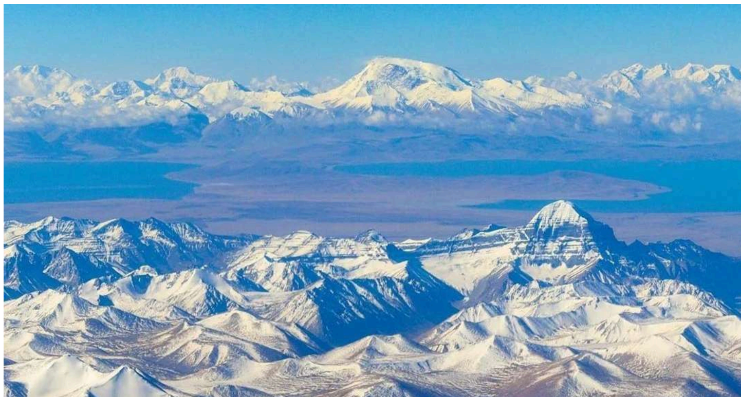
Большой Гималайский Хребет, гора Гурла Мандхата, озера Манасаровар и Ракшас, Кайлас

6 день. 24 сентября. Переезд в Сагу, важный пункт на пути к Кайласу. Высота – 4640 м. Ночевка в гостинице с базовыми условиями.