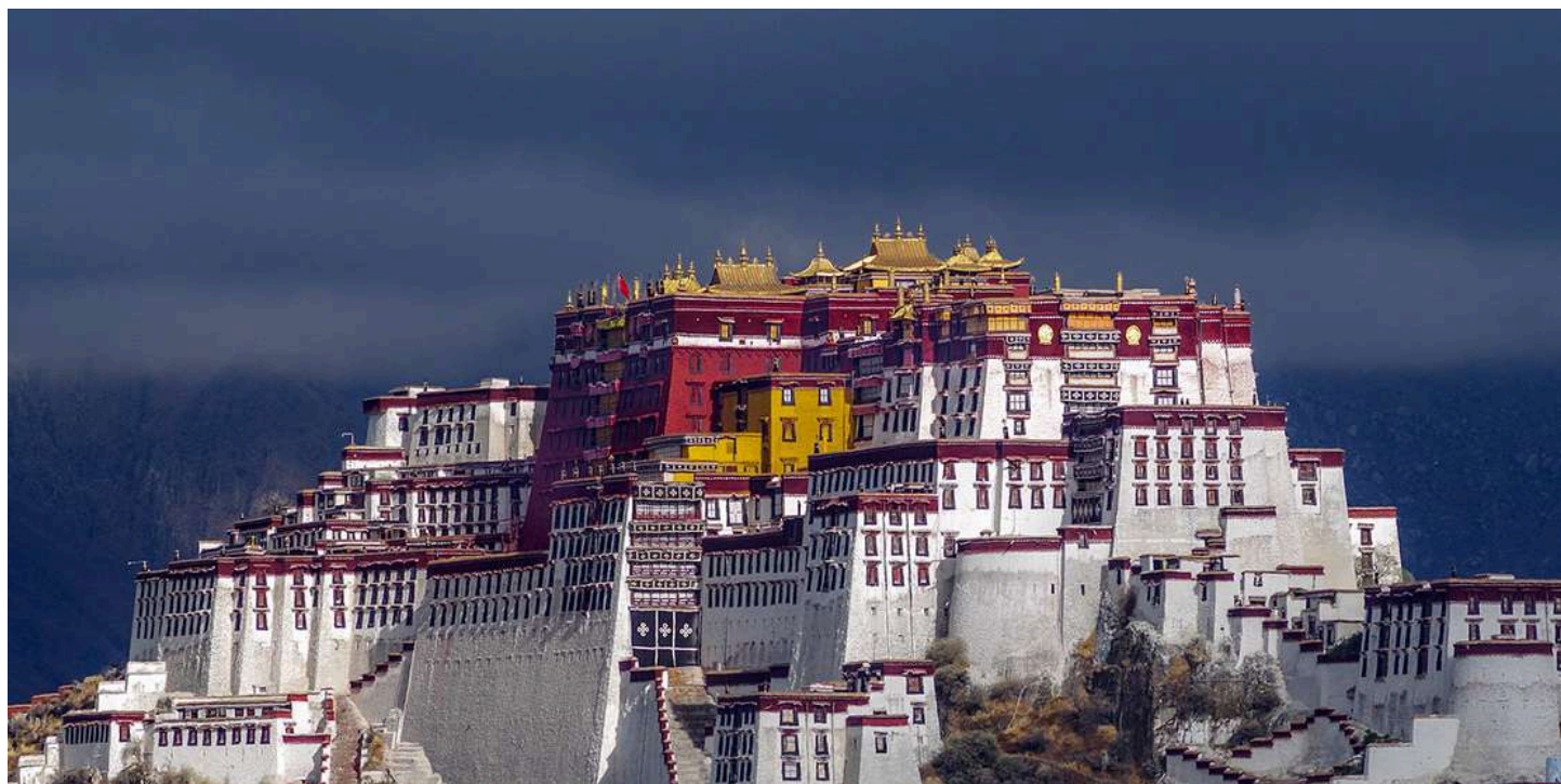
Дворец Потала в Лхасе

Монастырь Дрепунг. До 1959 г. в монастыре проживало более 10 тыс. монахов. В прошлом – самый большой монастырь Тибета. Основной дворец построен в 1518 г. по указанию Далай-ламы II, был основной резиденцией Далай-лам до середины XVII в.