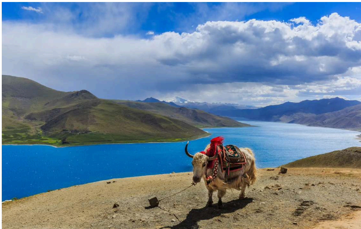
Озеро Ямдрок и белый як - священное животное Тибета

Пещеры Драк Ерпа (Drak Yerpa) – в 16 км. севернее Лхасы. Живописное и мистическое место, в котором медитировал сам Падмасамбхава со своей супругой Еше Цогьял.